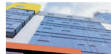
Das Kinderwunschzentrum in Dortmund