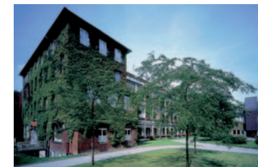
Die Frauenklinik des UK Düsseldorf