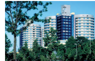
Das Zentralgebäude des UK Münster

Bayer Schering Pharma, Berlin Dr. Kade / Besins Pharma GmbH, Berlin Ferring Arzneimittel GmbH, Kiel Grünenthal GmbH, Aachen Gynemed Medizinprodukte GmbH, Lensahn Karl Storz GmbH & Co.KG, Tuttlingen Novo Nordisk Pharma GmbH, Mainz Organon GmbH, Oberschleißheim Procter&Gamble Pharmaceuticals-Germany GmbH, Schwalbach Serono GmbH, Unterschleißheim Ein Unternehmen der Merck Serono S.A. Synarela-Serviceteam Meditel, Karlsruhe