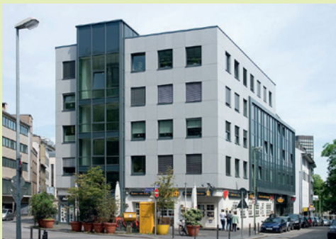
NOVUM – Zentrum für Reproduktionsmedizin Essen