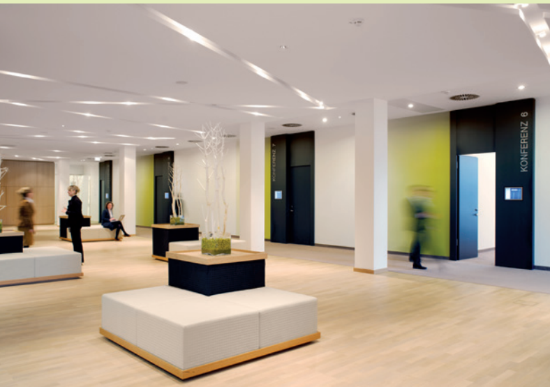
ATLANTIC Congress Hotel Essen