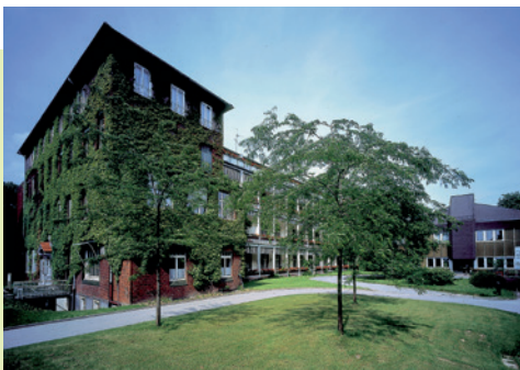
UniKiD, Universitätsklinik Düsseldorf – Klinik für Frauenheilkunde und Geburtshilfe