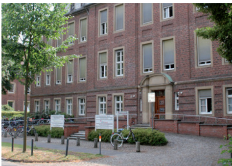
UKM Kinderwunschzentrum – Universitätsklinikum Münster