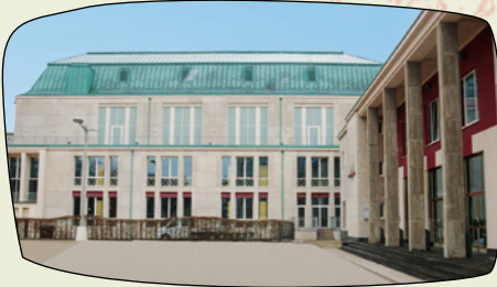
Tagungsort Philharmonie Essen Huysenallee 53, 45128 Essen